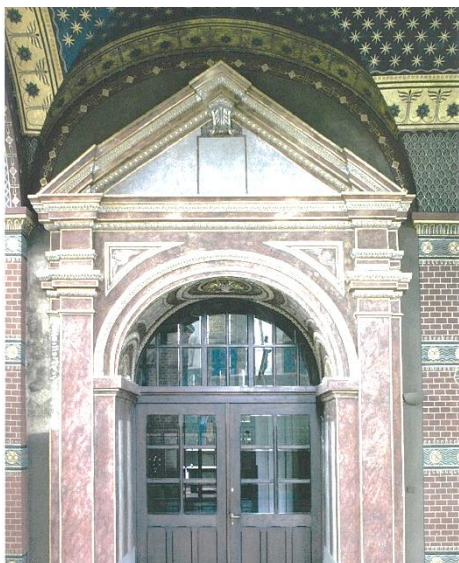
Kostel Panny Marie, Emauzské opatství

Beuronská škola vedle umění klade důraz na liturgii, pozornost věnuje jejím hodnotám, síle modlitby symbolicky zobrazené obrazem,