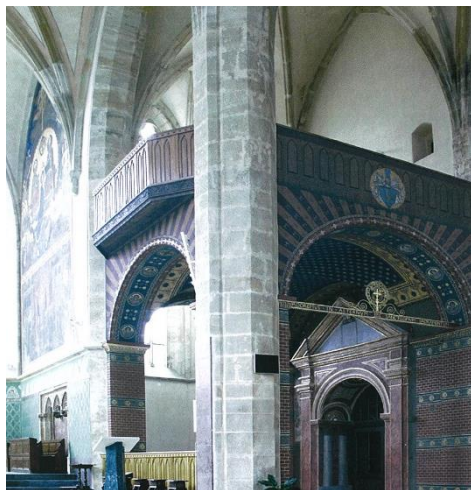
Kostel Panny Marie, Emauzské opatství

• Kostel sv. Gabriela v Praze, Smíchov (O Bohatě vyzdobený malbami beuronské školy)