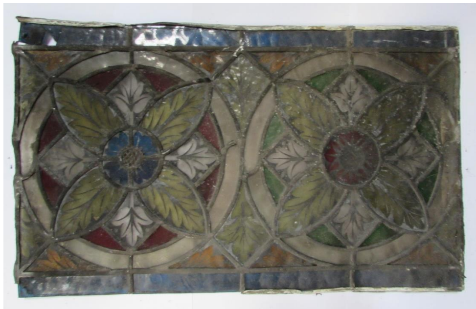
Jedna z nalezených vitráží

Varhany : v srpnu provedli varhanáři demontáž nástroje vč. skříně a vše bylo převezeno do dílen. Nyní varhanáři spolu s organologem upřesňují finální podobu. V návrhu intonéra je přidání jednoho rejstříku, se kterým záměr neuvažoval. Jsou to samozřejmě práce a finance navíc a tak zatím počítáme, zda se nám vejde rozšíření do projektu. Kontrolní den u varhanářů bude 30. září.