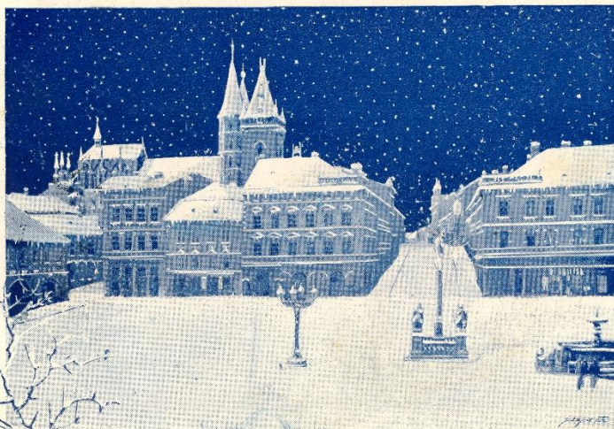
Pozdrav z Kolína.

Nákl. Aug. Lambda, Praha-II. 1910. — Zakonně chráněno.