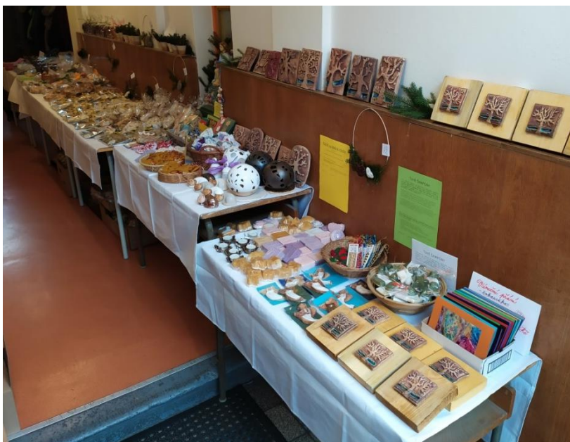
Adventní trh v DKŠŠ