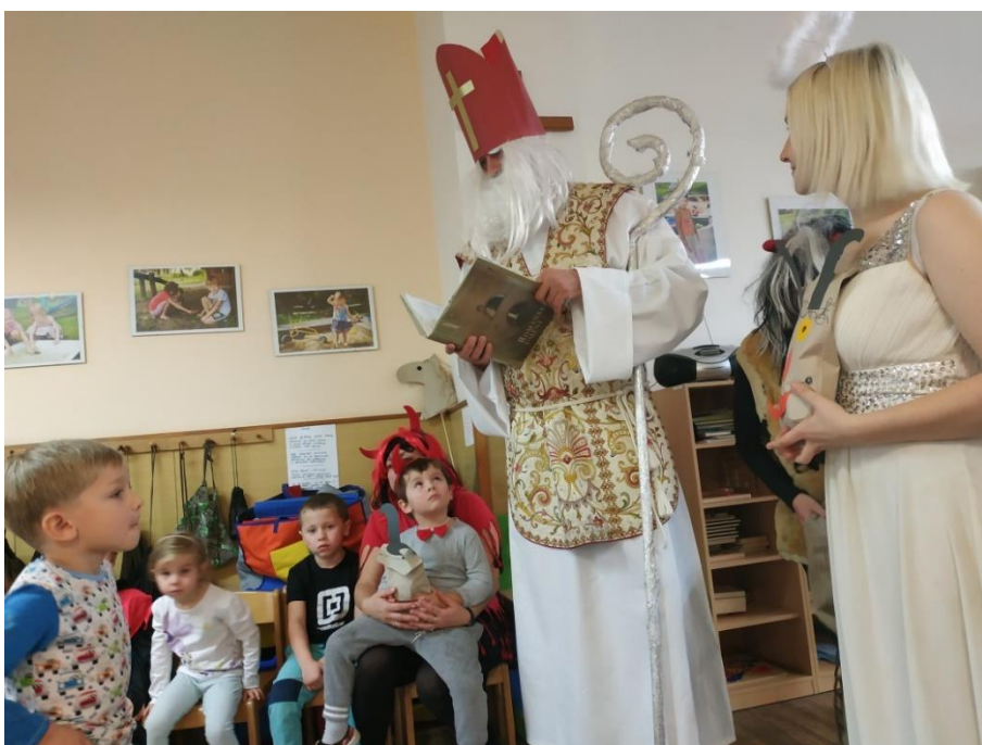
Svatý Mikuláš a zavítal i za dětmi církevní mateřské školky

Hodné a polepšené děti pochválil, těm neposedným promluvil do duše a vdechl novou naději. Všechny děti obdaroval malým dárečkem a odměnou mu byly mikulášské písničky a říkadla.